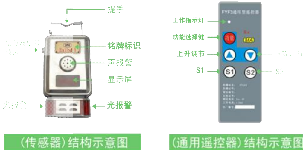
图 2. 传感器结构示意图

传感器主机的机壳采用不锈钢材料制造，整机防尘防水性能好。敏感元件采用微型限制扩散式气室，报警灯采用高亮度红色发光管。仪器正面为四位红色数码管显示测量值。整个设计新颖、体积小、调节方便。